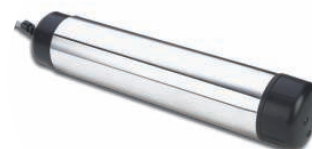
Capteur optique d'oxygène LDO