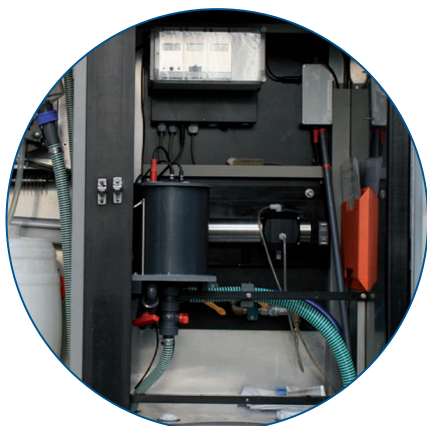
Fig. 1 : Sonde de mesure du nitrate NITRATAX plus sc (bypass), montée dans l'armoire de l'échantillonneur.

Un apport en carbone uniforme est aussi important pour la dénitrification que la fiabilité de la mesure des appareils pour la régulation. Le système de transmetteurs SC 1000 est donc relié par GSM au serveur d'entrée central, situé au sein du réseau de Düsseldorf du service technique HACH LANGE (fig. 3). Dès que le compteur interne d'une pièce d'usure est écoulé, un message d'avertissement est généré ou une erreur apparaît sur l'appareil de mesure de process concerné qui le signale automatiquement. Les membres de l'équipe responsable de la télémetrie mettent aussitôt en place la procédure d'assistance technique, par téléphone ou en envoyant un technicien