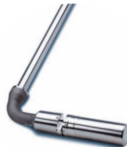
Sonde de mesure du nitrate NITRATAX plus sc

Information garantie, sur site ou en déplacement. Le transmetteur SC 1000 transmet les événements importants par SMS capteurs de process connectés. Les messages sont en même temps envoyés à notre centre de téléservice, où ils sont analysés par un personnel spécialisé. Si nécessaire, le problème est réglé par téléphone directement. Il est également possible de planifier un rendez-vous sur site, auquel cas le technicien dispose de toutes les pièces de rechange à portée de main. Votre avantage : la technologie SC vous permet de réaliser des économies de temps et garantit une meilleure disponibilité des capteurs de process, pour un niveau de sécurité de l'installation encore inégalé.