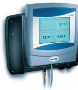
Transmetteur SC 1000 avec module GSM

HACH LANGE FRANCE S.A.S. 8, mail Barthélémy Thimonnier Lognes F-77437 Marne-La-Vallée cedex 2 Tél. +33 (0) 820 20 14 14 Fax +33 (0)1 69 67 34 99 info@hach-lange.fr www.hach-lange.fr