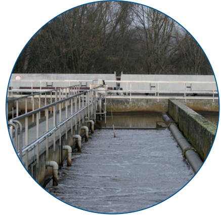
Fig. 4 : Bientôt, le carbone supplémentaire alimentera chaque canal de manière individuelle.

Le transmetteur modulaire SC 1000 est également parfaitement adapté à plusieurs autres tâches. Une mesure du débit inductive se trouve dans un canal de trop-plein, à proximité du point de mesure actuel du nitrate. En cas de fortes pluies, l'eau est déviée via cette conduite. « Cela ne se produit qu'à quelques reprises pendant l'année, mais cette installation est très importante pour obtenir une autorisation de traitement des eaux usées », explique Regina Eberle, responsable du laboratoire de Radolfzell. « Etant donné que nous ne pouvions poser aucun câble supplémentaire entre la salle de commande et ce point, nous avons rapidement intégré une carte d'entrée analogique pour le SC 1000 et connecté le débitmètre. La configuration fut très simple : elle a été effectuée par échange d'e-mails avec Düsseldorf. Tous les paramètres ont ensuite été configurés par télétransmission. Réellement pratique. » (fig. 5 et 6)