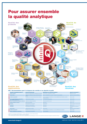
Fig. 5 : Poster AQA pour aider l'utilisateur ; peut être obtenu gratuitement auprès de HACH LANGE

HACH LANGE FRANCE S.A.S. 8, mail Barthélémy Thimonnier Lognes F-77437 Marne-La-Vallée cedex 2 Tél. +33 (0) 820 20 14 14 Fax +33 (0)1 69 67 34 99 info@hach-lange.fr www.hach-lange.fr