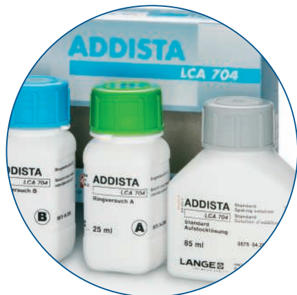
Fig. 1 : ADDISTA pour les analyses en laboratoire avec solutions d'essai A et B pour la participation gratuite à l'essai comparatif HACH LANGE et solution de référence/de concentration combinée pour les contrôles qualité internes