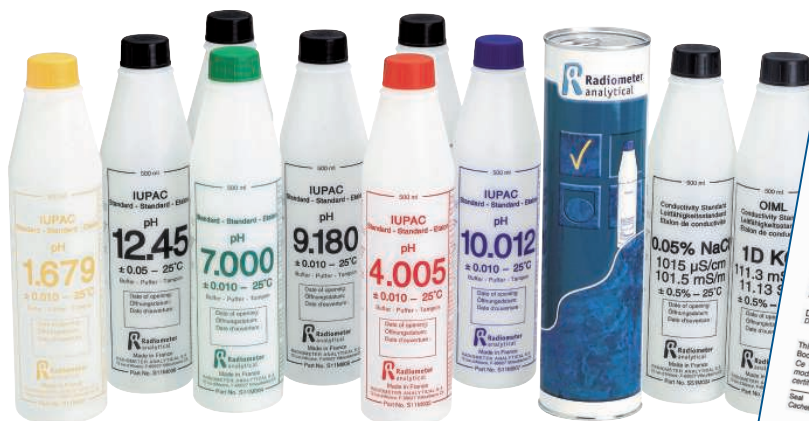
Aperçu des étalons de qualité certifiés produits par HACH LANGE pour l'étalonnage des appareils de mesure du pH et de la conductivité