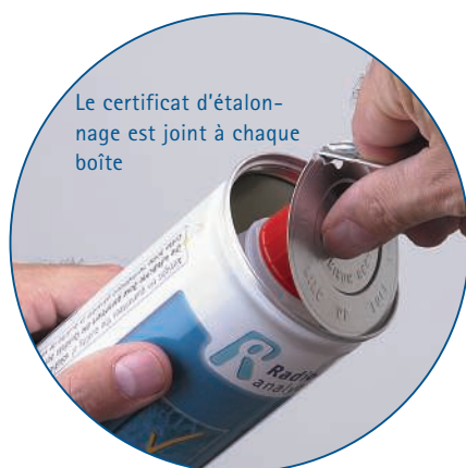
Fig. 2 : Durée de conservation garantie jusqu'à quatre ans, grâce à la protection offerte par la boîte étanche à l'air.

Afin de garantir la qualité à long terme des étalons de pH certifiés, la solution est d'abord versée dans un flacon propre à paroi épaisse en HDPE (polyéthylène haute densité). Le flacon est ensuite emballé dans une boîte scellée. Grâce à ce mode de conservation sûr, les solutions d'étalonnage HACH LANGE peuvent être entre-