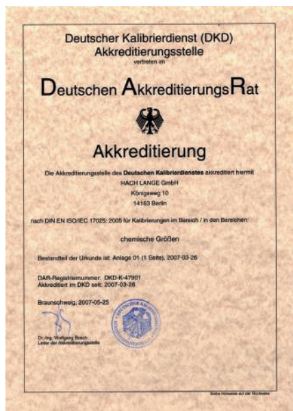
Fig. 1 : Certificat d'agrément du DAR pour le laboratoire d'étalonnage HACH LANGE

Depuis le printemps 2007, le laboratoire d'étalonnage de la société HACH LANGE GmbH situé à Berlin est agréé par le conseil d'agrément national allemand (DAR, Deutscher Akkreditierungsrat). Cet agrément est reconnu dans 45 pays dans le cadre de l'ILAC (International Laboratory Accreditation Cooperation, Coopération internationale sur l'agrément des laboratoires d'essais).